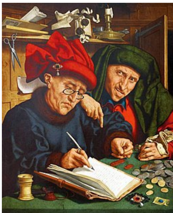
Quentin Massys – Due esattori 1520