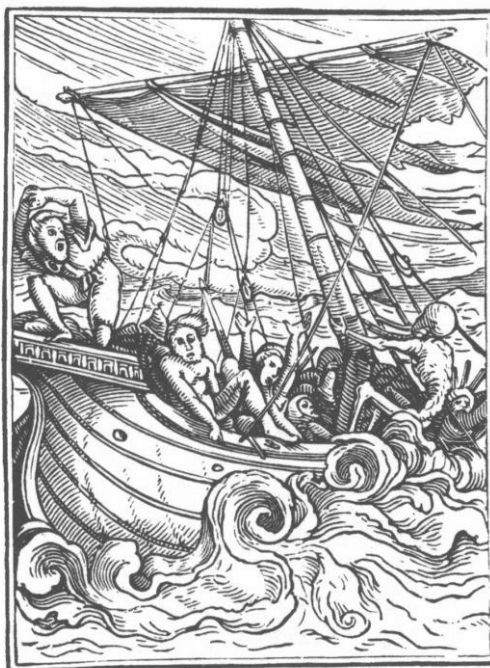
Albrecht Durer – Totentanz 1538; la Morte del Marinaio