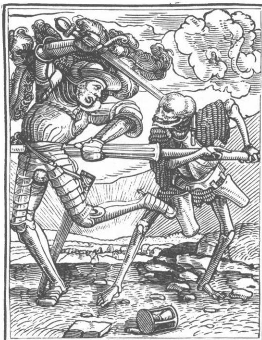
Albrecht Durer – Totentanz 1538; la Morte e il Lanzicheneco