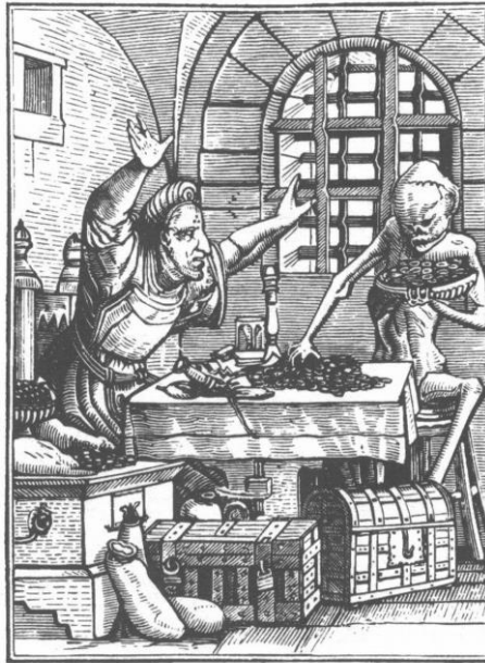
Albrecht Durer – Totentanz 1538; la Morte e il banchiere