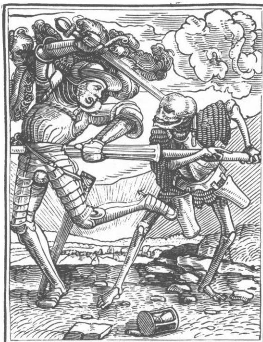
Holbein il Giovane – Totentanz 1538; la Morte e il lanzicheneco