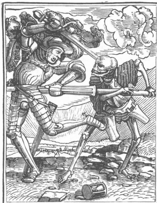
Albrecht Durer – Totentanz 1538; la Morte e il Lanzicheneco